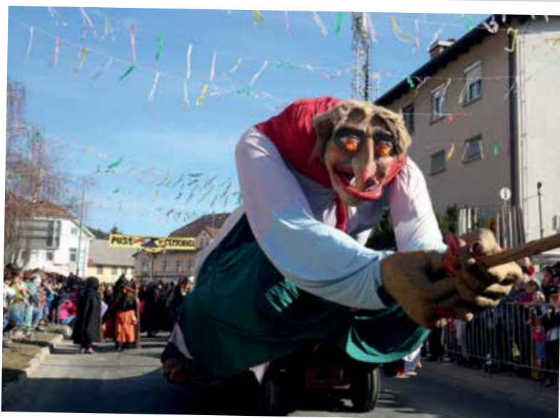
Letos je »zacuprala« vreme, polno ljudi, fajn vzdušje in še novo butalsko družino.

Kulturni dom smo med obema butalsko-čohastima predstavama napolnili še enkrat. Etnološka prireditev v izvedbi Hiše izročila O, ja stari ded, star'ga deda nočem imet je s šegavimi vsebinami zabavala obiskovalce v ponedeljek. V torek na večer pa je ubogi Pust potegnil takratkega in izpustil dušo, tako da smo se na pepelnično sredo v žalosti poslovili od njega na pustnem pogrebu.