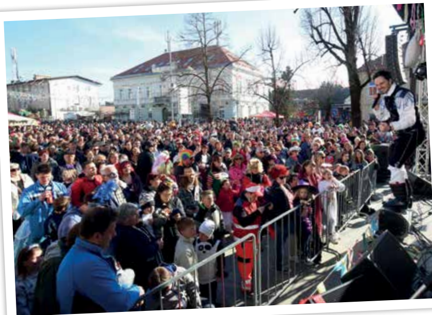
Za veselo vzdušje po karnevalu so poskrbeli Modrijani.

Leto bo hitro naokoli in spet bo prišel PUST z letnico 2020. Komaj čakamo!