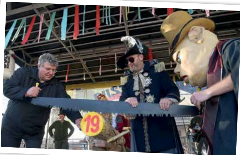
Predaja oblasti po Butalsko

Ja, Pusta je konec. Preden se začnemo pripravljati na novega, pa bi se radi še izvirno zahvalili vsem, ki so pomagali pri letošnji izvedbi.