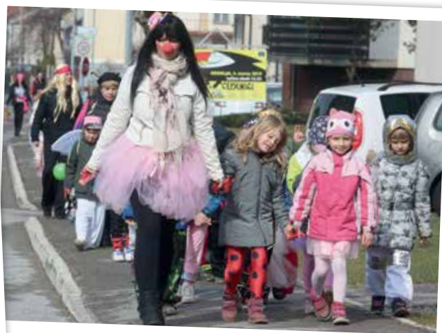
Parada najmlajših maškar na pustni torek po ulicah Cerknice