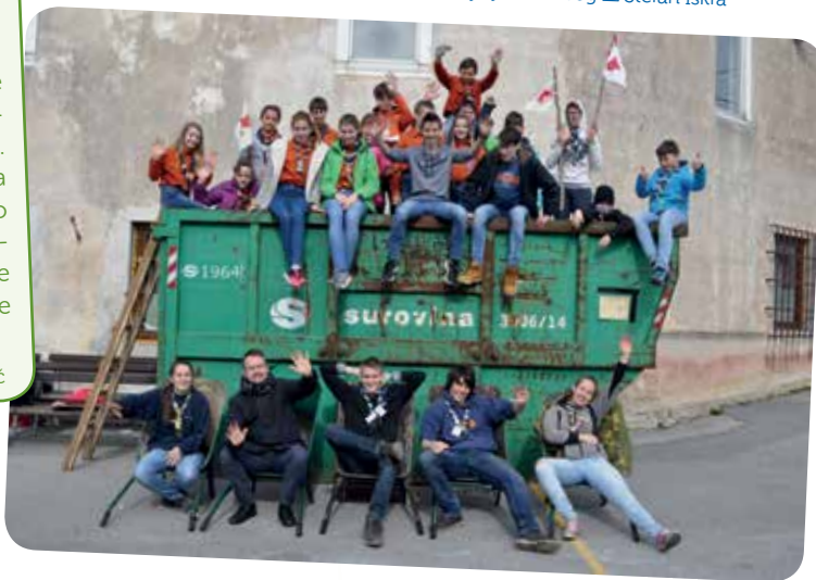
@ Ljubo Vukelič

V soboto, 16. marca, so se izvidnikom in vodnicam pridružili tudi volčiči in se v šestih ločenih skupinah odpravili po domovih Cerknice, Dolenje vasi in Dolenjega Jezera zbirat odvečen, star papir. V približno treh urah in pol nam ga je uspelo zbrati malenkost več kot dve toni! Na koncu so si skavti s pridnim delom zaslužili kosilo. Zbran denar bomo namenili posodobitvi skavtske opreme. Bodite pripravljeni! ✉ Iznajdljivi kozorog @ Štefan Iskra