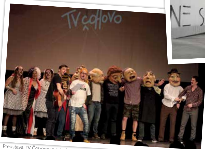
Predstava TV Čohovo je bila dvakrat razprodana.