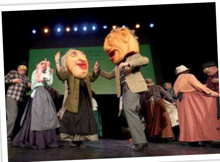
Etnološka prireditev O, ja stari ded, star'ga deda nočem met!