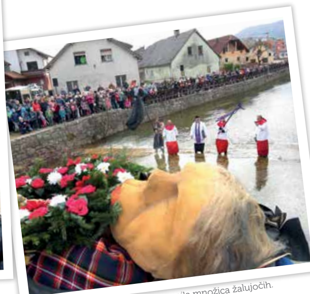
Rajnega je na zadnjo pot pospremila množica žalujočih.