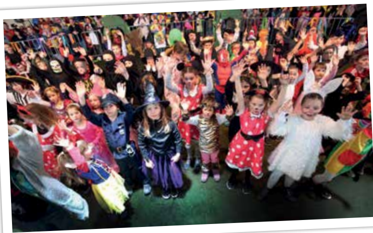
Z otroško maškarado rastejo generacije pustnih zanesenjakov.

O izvirnosti letošnjega pustnega karnevala ne gre izgubljati besed. Poleg čisto nove skupine Butalcev – Butalske družine – so se na karnevalu prvič, upamo, da ne zadnjič, predstavili Dunking devils, svetovno znana akrobatska skupina, ki je skakala na svoj posebej za karneval narejen Trumpolinski zid. Vreme je bilo skoraj kičasto, vzdušje ob izjemnem številu obiskovalcev prav tako.