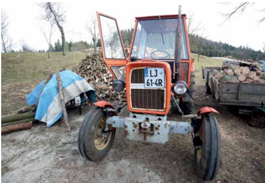
Kot vsako vozilo mora biti tudi traktor tehnično brezhiben, imeti zavarovanje in podaljšano prometno dovoljenje.

Vsako leto policisti obravnavajo več prometnih nesreč, ki jim je botrovala slaba priprava vozila za delo, zato je ustrezna oprema traktorja izrednega pomena. Policisti opazajo, da prav v tem začetnem, pomladnem obdobju lastniki traktorjev, motokultivatorjev ter delovnih strojev svojih strojev ne opremijo tako, da bi bili primerni za udeležbo v cestnem prometu. Preden se samostojno peljemo po cestišču s traktorjem, moramo pridobiti voziško dovoljenje F-kategorije;